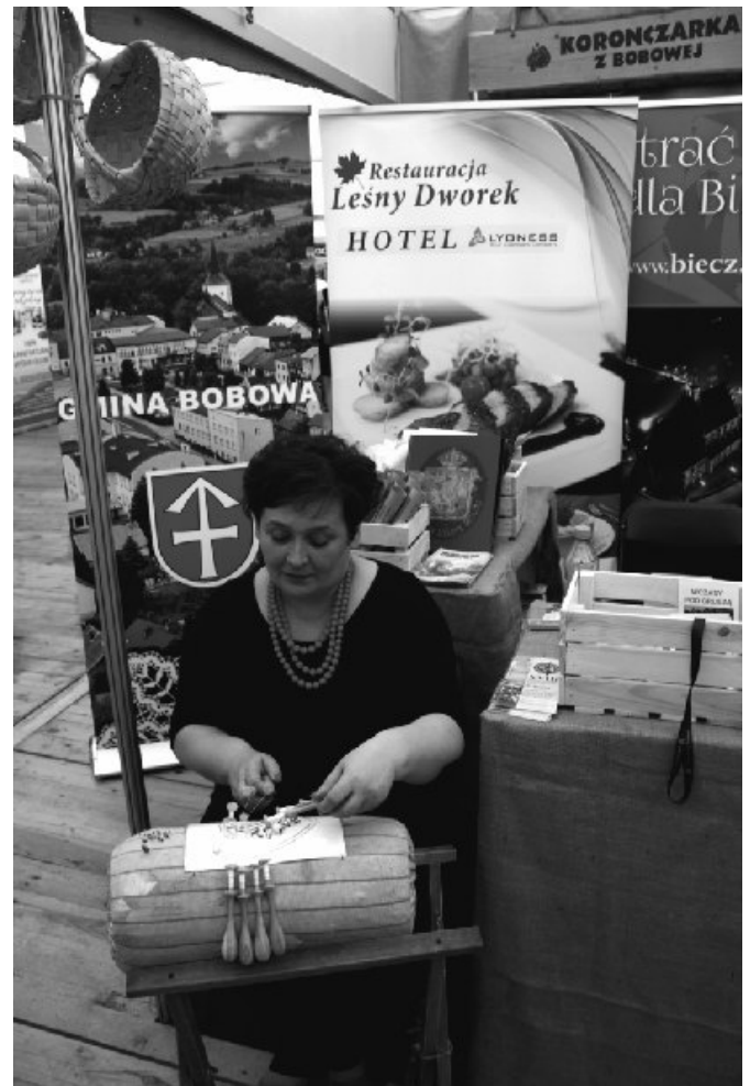
Bobowskie stoisko podczas Międzynarodowych Targów Turystyki Weekendowej w Chorzowie