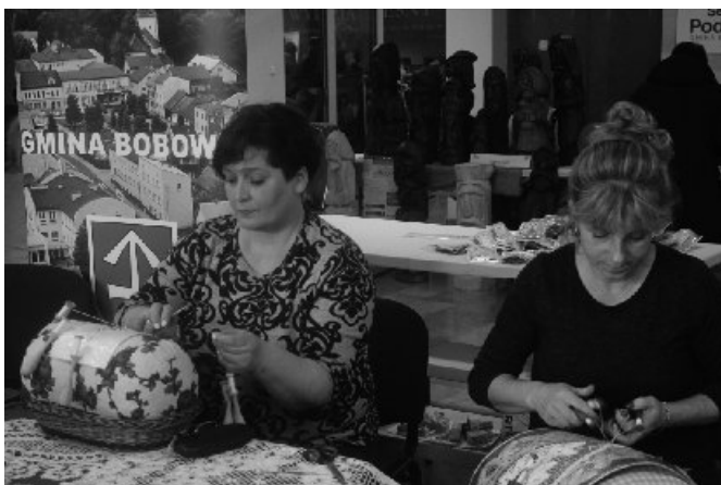
Stoisko podczas Targów Agroturystycznych w Krakowie